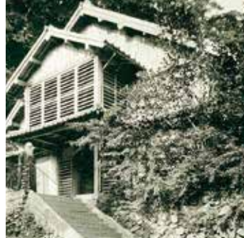
Primera iglesia Sakitsu