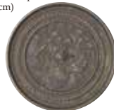
① Espejo japonés (colección particular) (10,8×10,8 cm×1,0 cm)