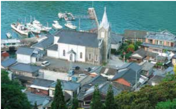
Ruinas de la casa del jefe de la aldea Yoshida (Sitio de la actual Iglesia Sakitsu)

Este lugar es el sitio en el que fue la residencia del jefe de la aldea de Sakitsu y durante el período en que el cristianismo estaba prohibido, la gente pisaba imágenes sagradas (Efumi) para comprobar si eran cristianos o no. Se dice que después de que se levantó la prohibición, el padre francés Halb eligió este sitio con un fuerte deseo de construir una nueva iglesia (actualmente la Iglesia Sakitsu F ) en 1934, y colocó el altar en el sitio en donde se realizaba el Efumi.