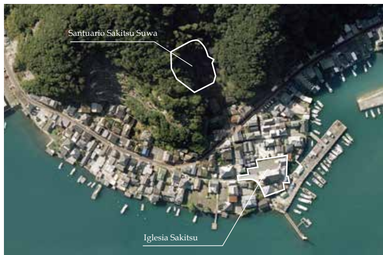
Aldea actual de Sakitsu