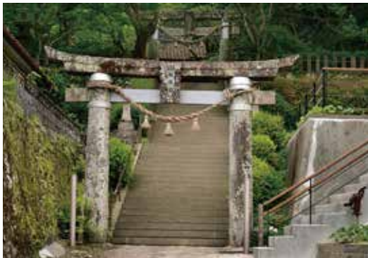
① Santuario Sakitsu Suwa