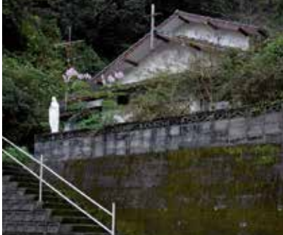
① Un antiguo monasterio cerca del Santuario Sakitsu Suwa