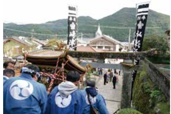
① Gran Festival del Santuario Sakitsu Suwa

El Santuario Sakitsu Suwa fue fundado en 1647, durante la prohibición del cristianismo, como deidad guardiana de la aldea. Los cristianos ocultos de la aldea de Sakitsu aparentemente pertenecían al templo como budistas, pero también eran feligreses del santuario de Sakitsu Suwa. En 1805, durante la detención de los cristianos ocultos en Amakusa, los funcionarios confiscaron objetos religiosos que habían estado escondidos. Incluso ahora, es venerado como un santuario que representa a la región y los eventos se llevan a cabo en primavera y otoño.