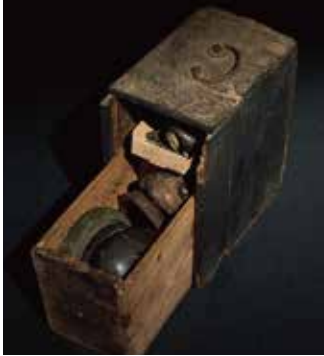
Objetos devocionales cristianos

*Los objetos devocionales cristianos están en exhibición en el Museo Sakitsu de Minatoya.