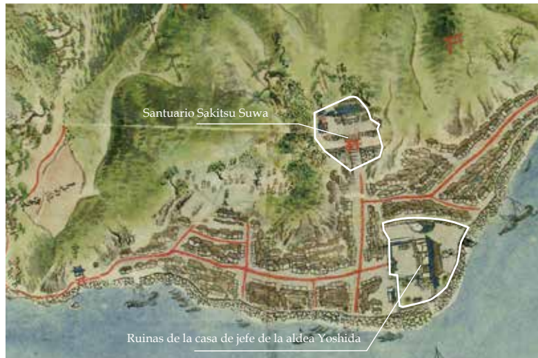
Mapa de la aldea de Sakitsu (ciudad de Amakusa desde 1842)