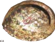
① Abulón (9,7×12,4 cm×2,9 cm)